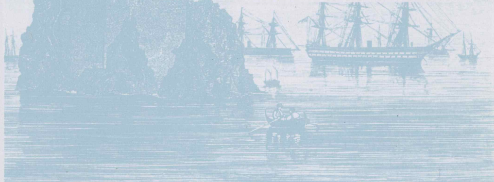
MADEIRA: Fortaleza do Ilhéu, segundo uma gravura de Pedrozo, publicada em "Archivo Pitoresco", 1864.