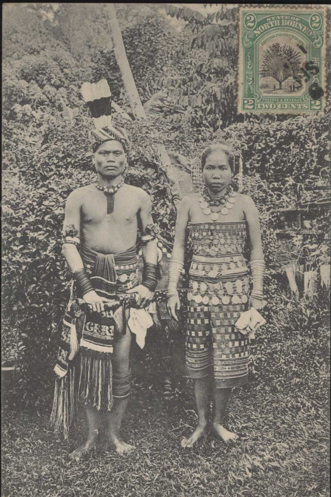
A Dyak couple, Borneo