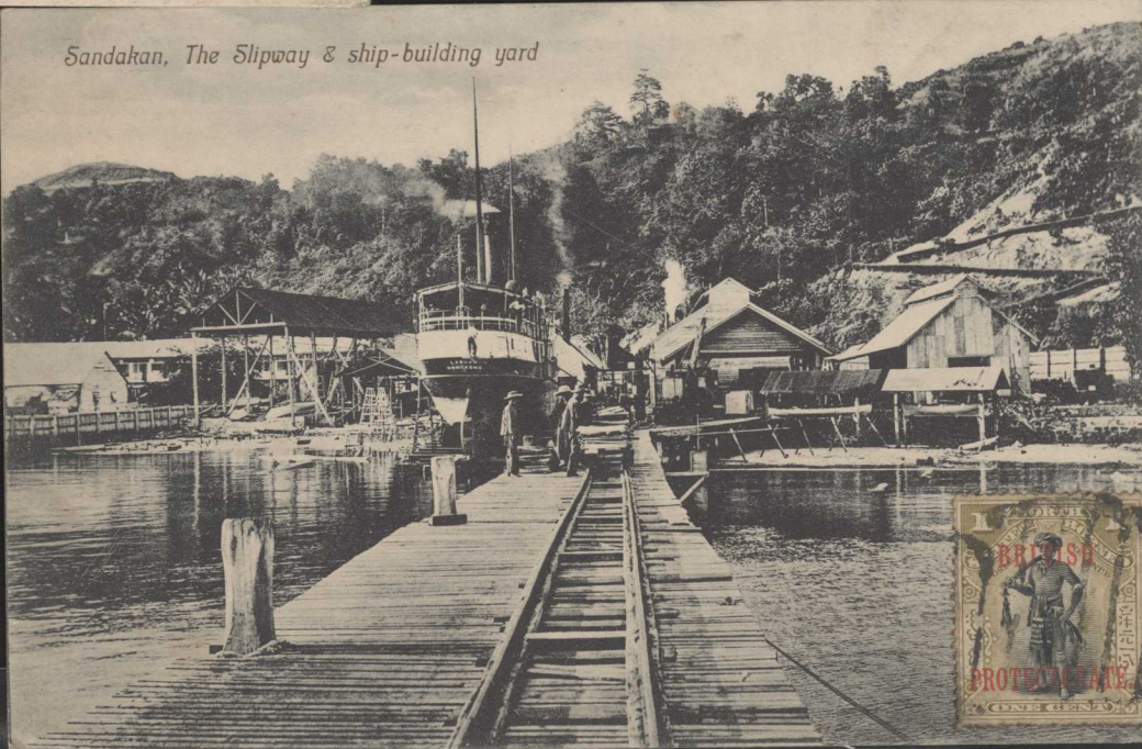
Sandakan, The Slipway & ship-building yard