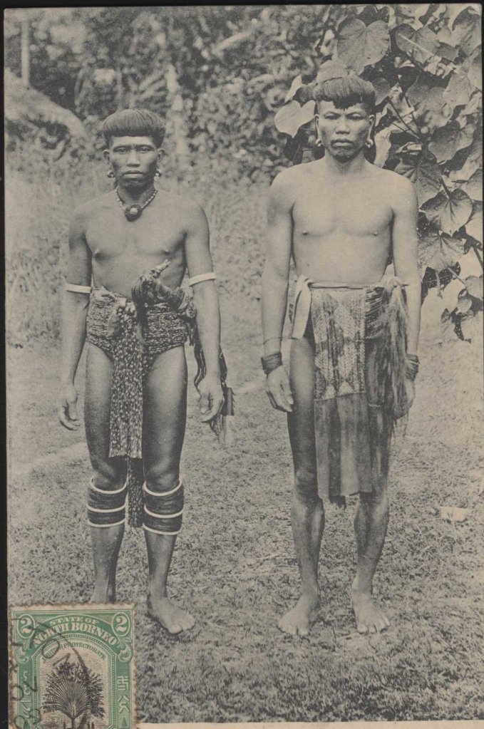
Dyaks, wild men of Borneo