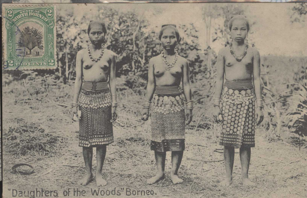
"Daughters of the Woods" Borneo.