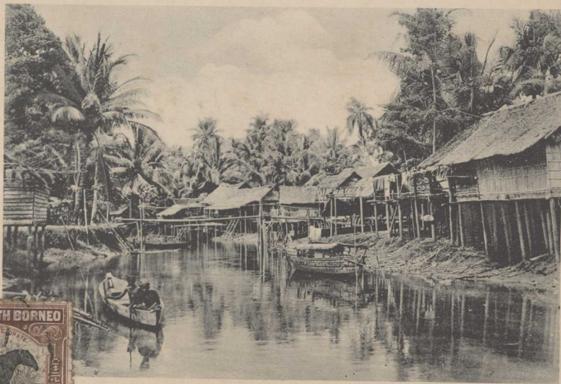
Native Village on Inanam River, British North Borneo