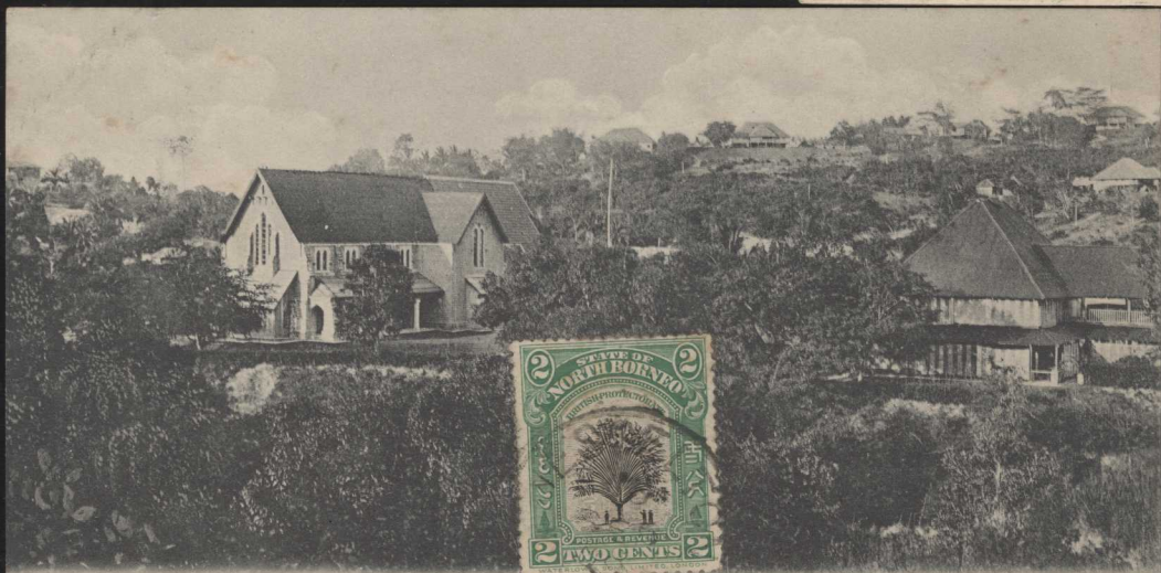
Sandakan, Church of St. Michael & All Angels. The Parsonage. British-North-Borneo.