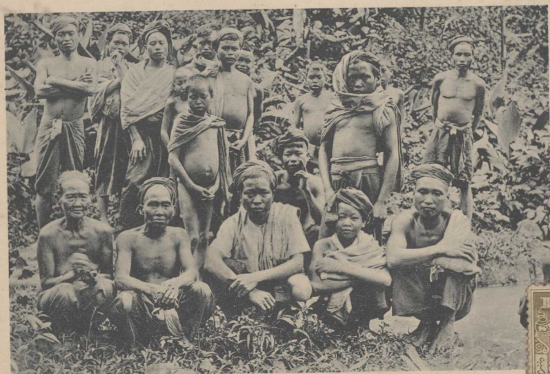
Group of Dusuns, a diligent tribe of British North Borneo