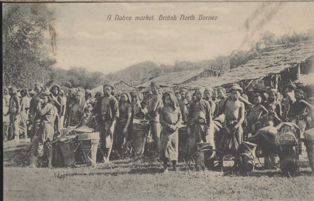
A Native market, British North Borneo