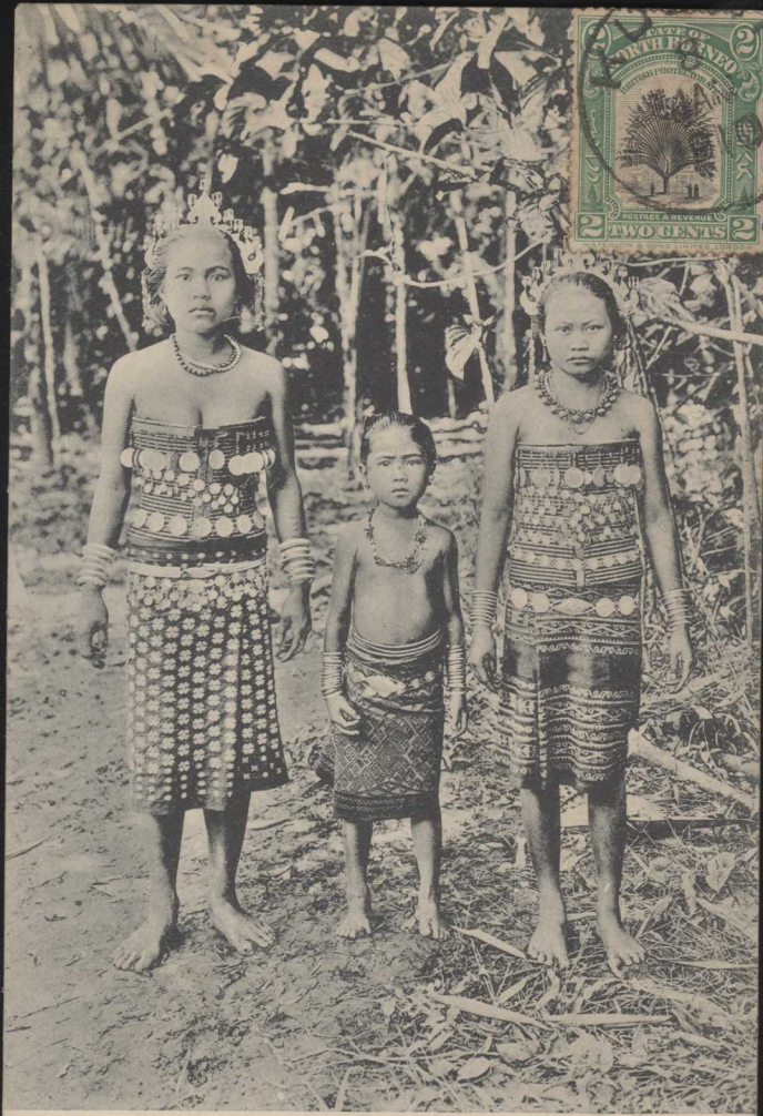
Fashionable Dyak women, Borneo