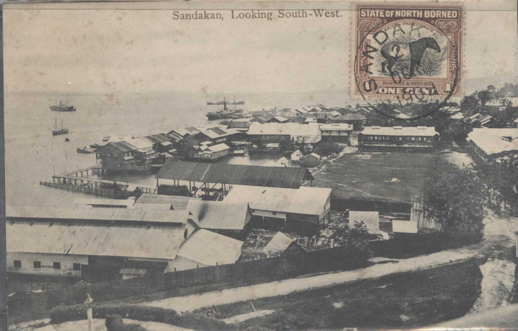
Sandakan, Looking South-West.