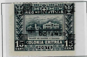
Sass: 46b; dble o/print, one inverted