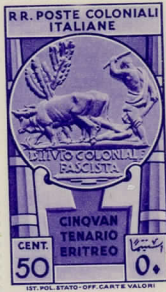
SG40: 50c bright violet