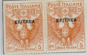
SG50c: 20c+5c orange Sass:44f

1916 – Government Palace Massawa; perforation 13½ overprint variations on SG52: 15c slate