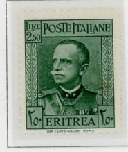
1933 - Soggetti diversi - Legg.: COLONIE ITALIANE - ERITREA - Dent. 14