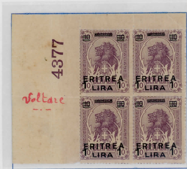
SG63: 1L on 10a lilac Block of four with selva annotated with control numeral 4377 and inscribed Voltare