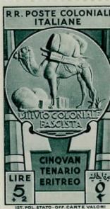
SG44: 5L+2L Deep blue-green