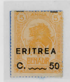
SG62:50c on 5a yellow-orange Sass: 59c bars misplaced vertically