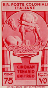
SG41: 75c carmine-red