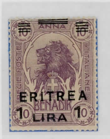
SG63: 1L. on 10a lilac Sass: 60ca ERITREA and bars moved vertically