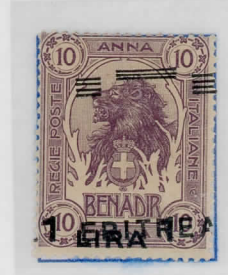
SG63: 1L on 10a lilac Sass:60ea ERITREA and bars printed obliquely