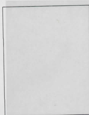
SG52c:15c slate; vertical pair one showing T omitted Sass: 46c