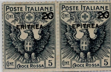
SG49b:20c on 15c+5c slate Sass:43f