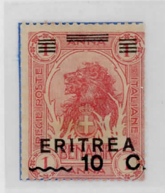
SG59:10c on 1a rose Sass: 56h value misplaced