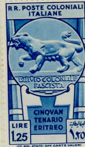
SG42: 1L.25 blue