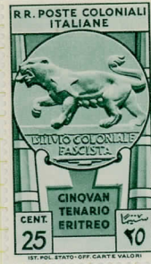
SG39: 25c green