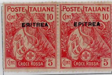
SG47b: 10c + 5c carmine Sass:41f

1916 – stamps of 1915/16 overprinted Pairs with one showing the variation EPITRERA for ERITRERA