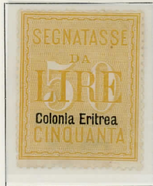
1904 - Segnatasse d'Italia del 1904 sopr.: Colonia Eritrea