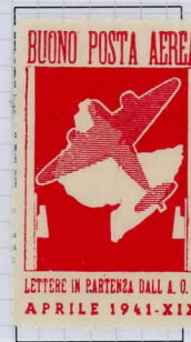
Sassone 2: carmine