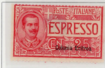
1907-20 - Espressi d'Italia del 1903-20 sopr.: Colonia Eritrea