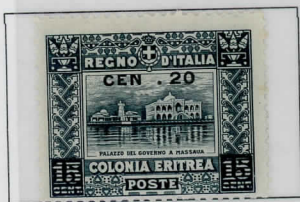
SG52c: 15c slate; T omitted Sass:46c

1916 – Government Palace Massawa; perforation 13½ overprint variations on SG52: 15c slate