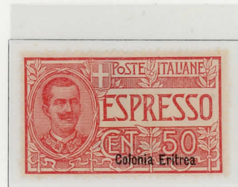
1924 - Leggenda: ESPRESSO - Dent. 14