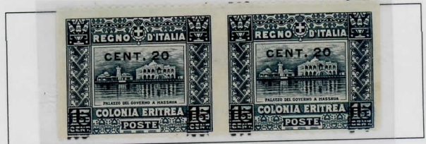
Sass: 46i/k; pair with no vertical perforation between pair and no perforation on the right nor left