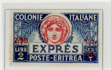
1941 - Recap. autoriz. d'Italia del 1930 sopr.: ERITREA