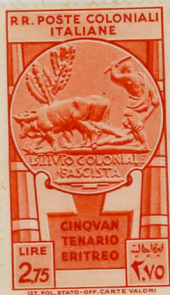
SG43: 2L.75 orange-vermilion