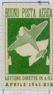
Sassone 1: green-yellow

The green version is known only without gum and was intended for destinations within the A.O.I., with a carmine version for outgoing letters from the A.O.I. area.