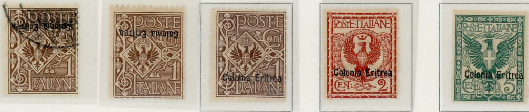
1903-22 - Franc. d'Italia del 1901 soprastampati: Colonia Eritrea