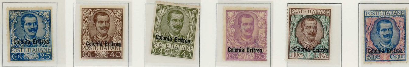
1905 - Franc. d'Italia del 1905 con la stessa soprastampa