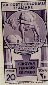
SG38: 20c purple