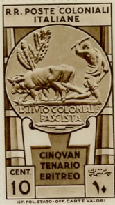
SG37: 10c brown