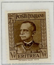
1931 - Effigie di Vittorio Emanuele III - Dent. 14