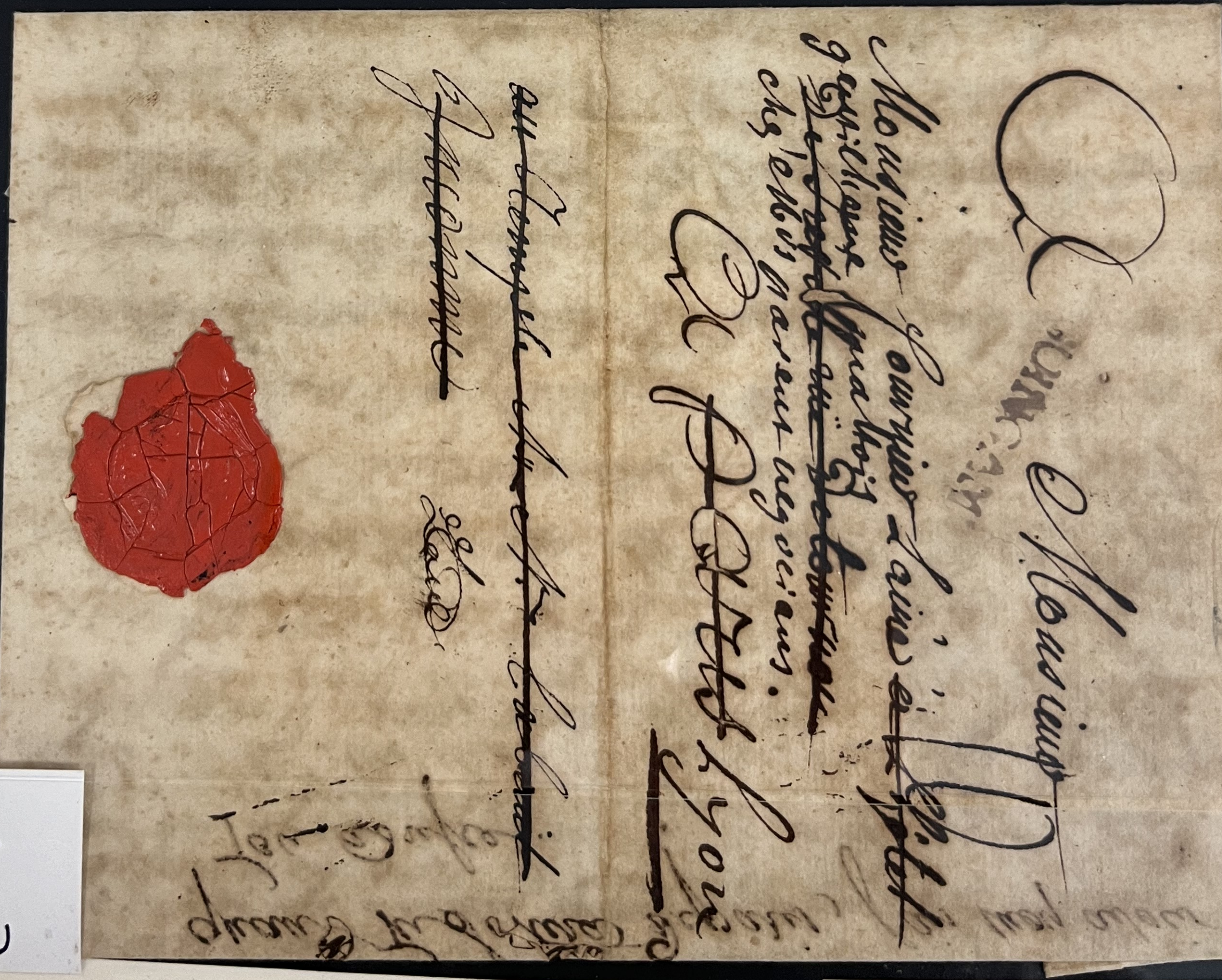
1759 TO LYON